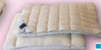
ドイツ製羊毛敷布団 シングル ¥29,400 (税込) ~

登山家が絶賛するポーラテック製フリース。軽くて暖か、蒸れることもなく、しなやかなフィット感と伸縮性をもつオリジナル品。