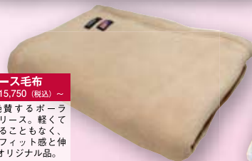
フリース毛布 シングル¥15,750 (税込) ~

イタリア製マニフレックス社のハイグレードタイプ。二層式で理想的な睡眠姿勢を維持する画期的な敷き寝具です。12年の保証付。