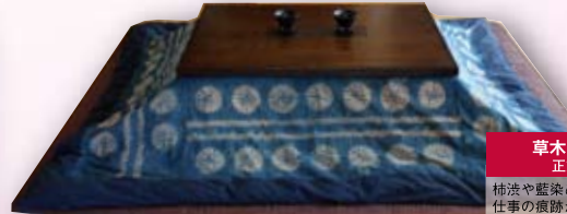
草木染め炬燵カバー 正方形 ¥28,350 ~

ドイツの名門・ピラベック社スイス工場の羽毛掛ふとん。薬品加工を一切せず、世界最高の羽毛を使って極上の快眠を約束します。